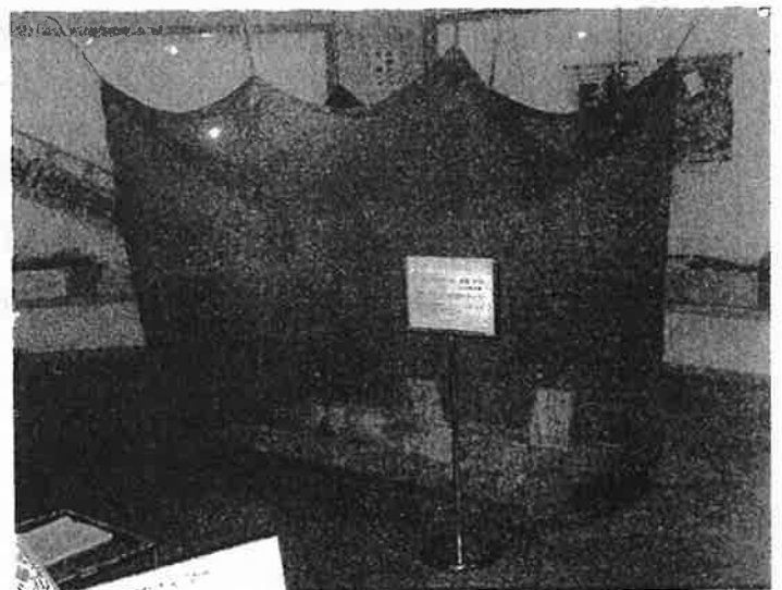
体験コーナー 蚊帳