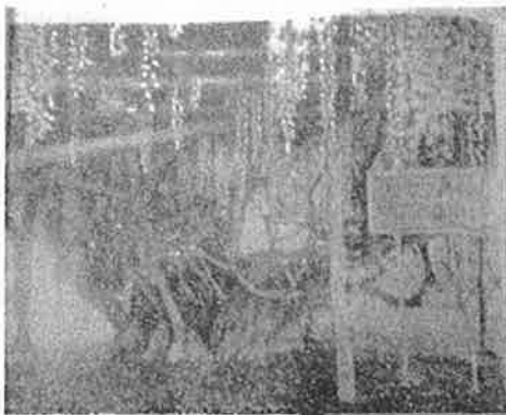
大正元年 牛島藤花園