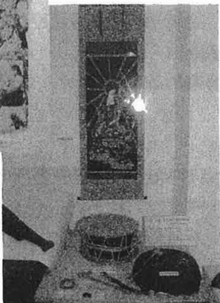
大場村新田組 念仏講の用具