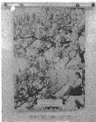
桐組合のポスター